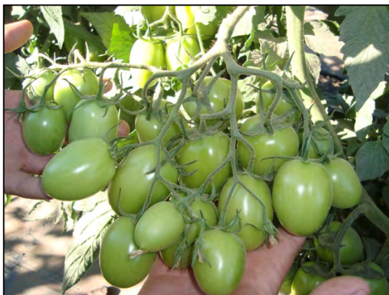
Blue 76+ Blue Life

En la parte tratada se observan racimos completos de 24 tomates, en la parte del testigo se observan los racimos tradicionales: