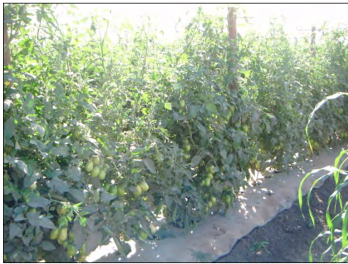
Blue 76+ Blue Life