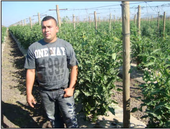
Blue 76+ Blue Life

Se observa mayor desarrollo en la planta tratada con Blue Life + Blue 76, más porte más racimos de tomate, menor numero de enfermedades que en la tabla testigo: