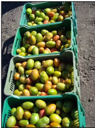
Blue 76+ Blue Life